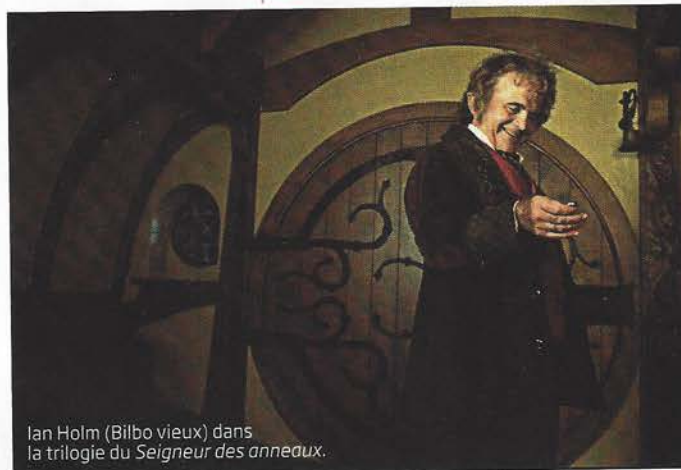
Ian Holm (Bilbo vieux) dans la trilogie du Seigneur des anneaux .

Tolkien a vendu, en 1966, les droits des quatre livres ( Le Hobbit et la trilogie du Seigneur des anneaux ) à United Artists. Le studio les revend, en 1976, au producteur Saul Zaentz mais garde les droits de distribution du Hobbit , c'est-à-dire les potentielles recettes d'une exploitation en salle.