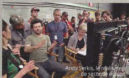
Andy Serkis, le réalisateur de seconde équipe.