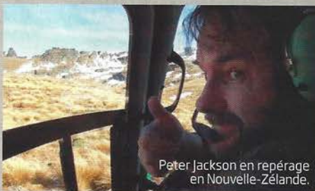
Peter Jackson en repérage en Nouvelle-Zélande.

Les vidéos de Peter Jackson sur Facebook, les infos de Ian McKellen sur Twitter (@ianmckellen118)