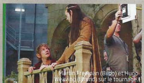
Martin Freeman (Bilbo) et Hugo Weaving (Elrond) sur le tournage.