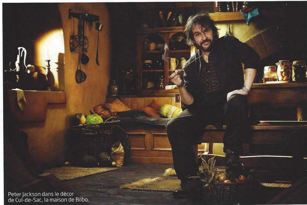
Peter Jackson dans le décor de Cul-de-Sac, la maison de Bilbo.

En février 2011, à quelques semaines du tournage, Peter Jackson est hospitalisé en urgence. Il est atteint d'un ulcère perforé nécessitant une opération immédiate. C'est convalescent qu'il se dirige vers les studios de Stone Street avec un mois de retard. Le 21 mars, le premier clap est enfin donné. Espérons que les galères s'arrêtent là pour Bilbo le Hobbit : un voyage inattendu et son réalisateur ! ■